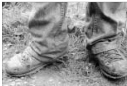
La damaun eran chautschas e chalzers anc Schubers.