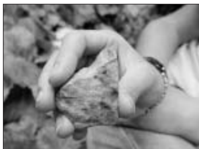
Sa sch'in Neandertaler ha ina giada gi enta maun quest crap?