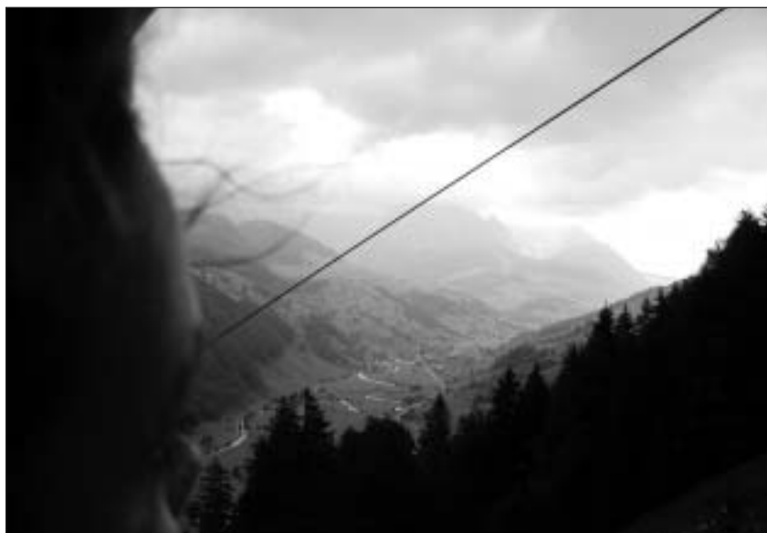
La vista vers il Toggenburg sura. Il Sântis sa zuglià en nivels.

L'enviern è la pendiculara serrada. Dapli infurmaziuns datti sut 079 537 77 20 ni tar www.wildmannli.ch .