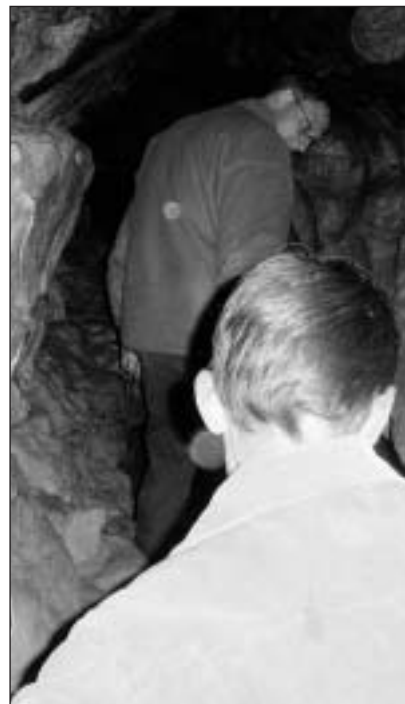
Entadim la tauna vegni pli stretg.