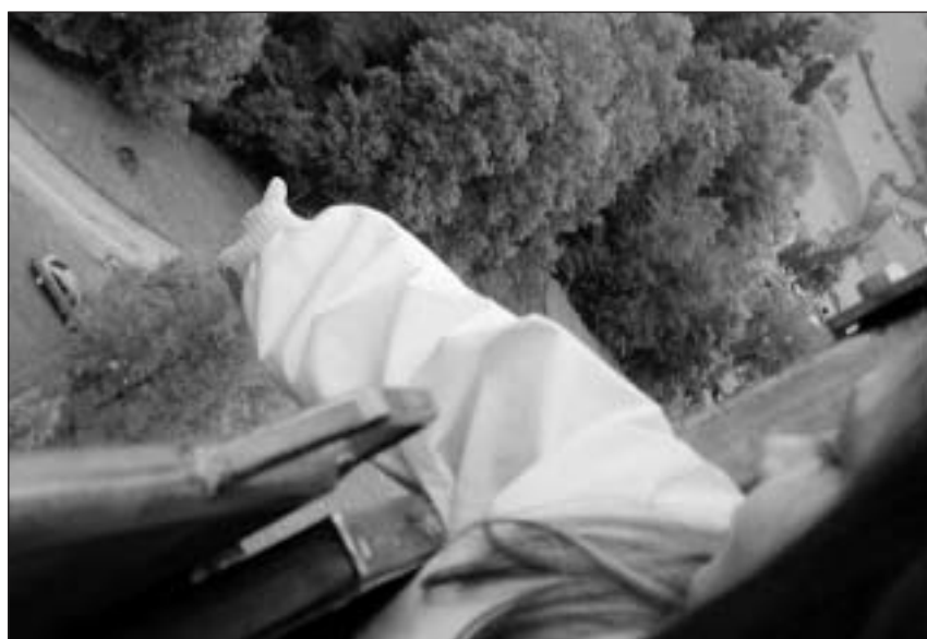
«Mamma, guarda giu là igl asen.» Ma la mamma na vul betg guardar en la profundità.